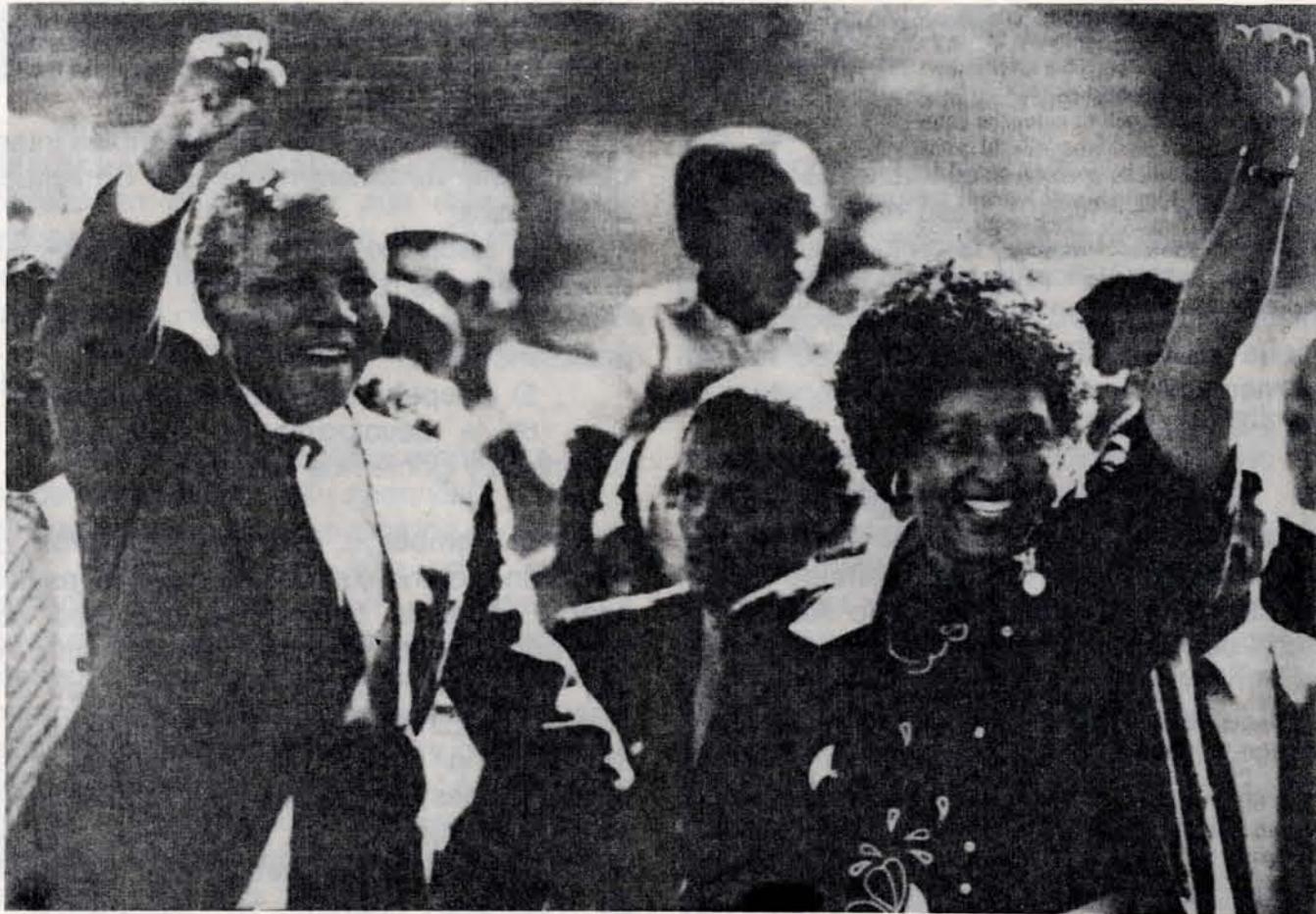
Emerging into the light after more than 27 years in jail, Mandela, hand in hand with his wife Winnie, raised the clenched fist of victory

Por otro lado, el más oscuro, pero la más cruda realidad sudafricana, la violencia que se ha acentuado en los últimos meses hasta la actualidad; sin embargo, durante ese año se recrudeció, cobrando miles de víctimas en los barrios negros (algunos suburbios blancos), a pesar de los esfuerzos de reconciliación.