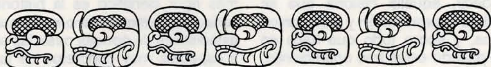
Animales Prehispánicos, Serie de Información Gráfica del Archivo General de la Nación, México, 1980. p.32.